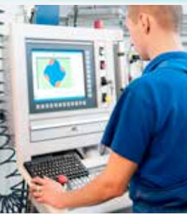
Ultrasons et des traducteurs et consommables associés